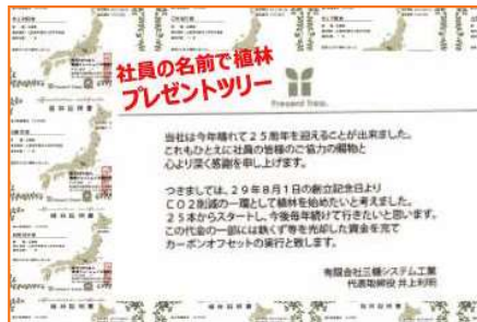
■プレゼントツリー(植林証明書)