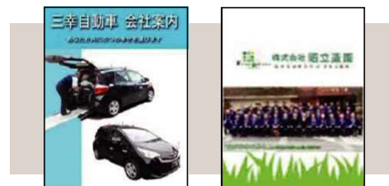
■学生が作成した会社案内